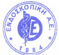
Κίμων Καλόγλου Πρόεδρος και Δ/νων Σύμβουλος